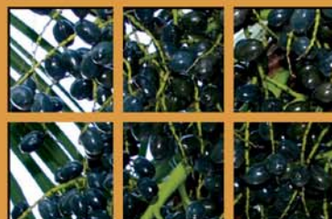
AÇAÍ Bioflavonóides e Polifenóis

Combinação exclusiva de polifenóis concentrados do açaí e do guaraná com carotenóides do urucum