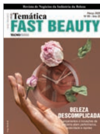
Capa: Claudia Carvalho sobre imagem © freepik / Freepik