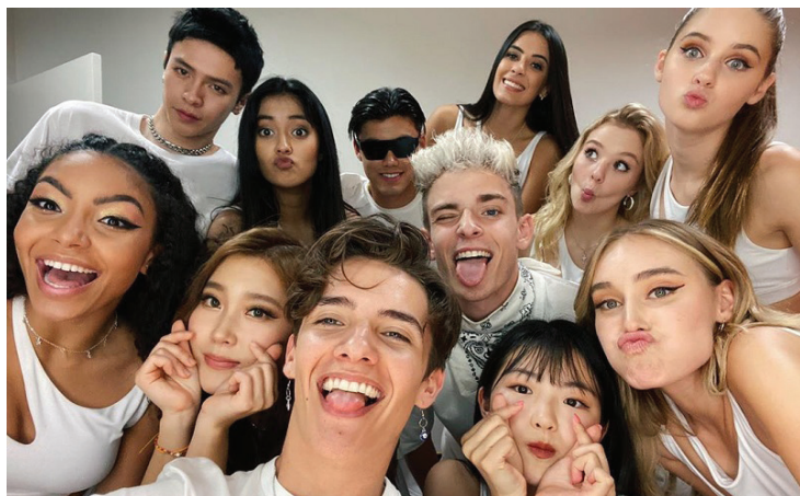
A Rexona aposta em parcerias de aproximação com o público-alvo, como a estabelecida com o grupo Now United

Ela destaca que o formato aerossol é o mais consumido no mercado, pois oferece a conveniência da secagem rápida sem contato direto com a pele no momento da aplicação. Outra forma de apresentação apreciada pelos consumidores é o roll-on, um aplicador de contato cremoso, com embalagem que desliza na superfície da pele. “Rexona roll-on tem um formato prático e de cabeça para baixo, para melhor aproveitamento do produto”, comenta.